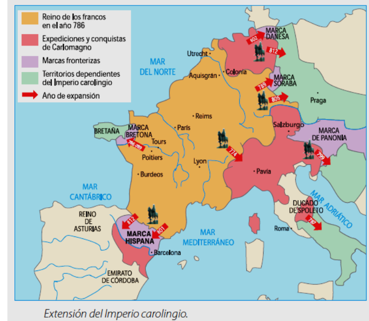
Extensión del Imperio carolingio.

Con él, en la Europa cristiana nuevamente se volvió a hablar de